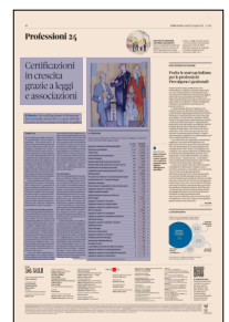
Peso: 1-3%, 10-45%

zione riconosciuti da Accredia per valutare i professionisti. E sono 91 le norme tecniche Uni che indicano gli standard di qualità per le persone. «È un mercato molto dinamico - esordisce Filippo Trifiletti, direttore di Ac-